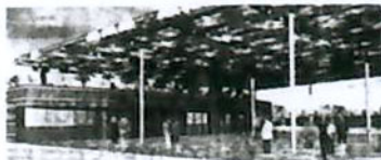
Le site « Symbio » se situe sur l'ancien site de la potasse à Mulhouse. La partie en construction est le Bioscope.